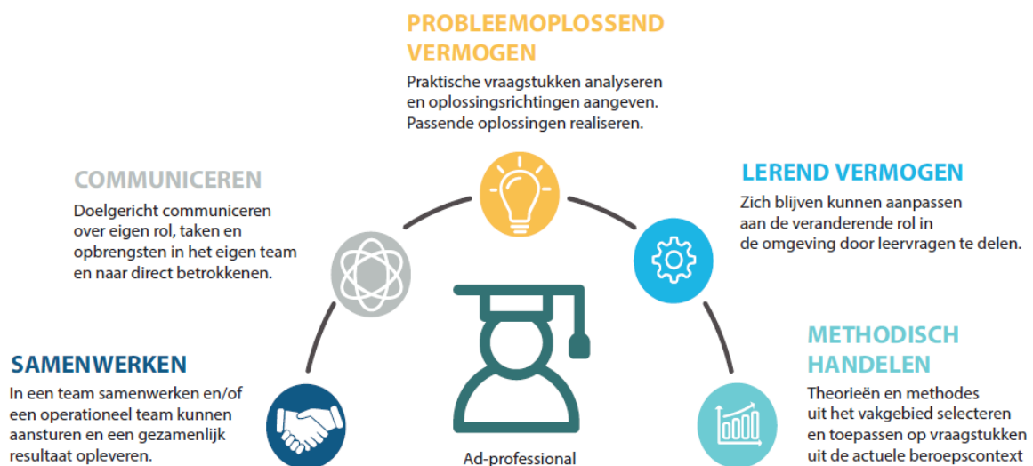
Figuur 3: Vijf leerresultaten van Beschrijving niveau 5 Associate degree

De beschrijving van niveau 5 voor Ad-opleidingen is vormgegeven aan de hand van vijf generieke Ad-leerresultaten (Overlegplatform Associate degrees, 2022). Deze generieke leerresultaten zijn niet los van elkaar te zien en beschrijven in samenhang met elkaar het niveau 5. Deze leerresultaten zijn: