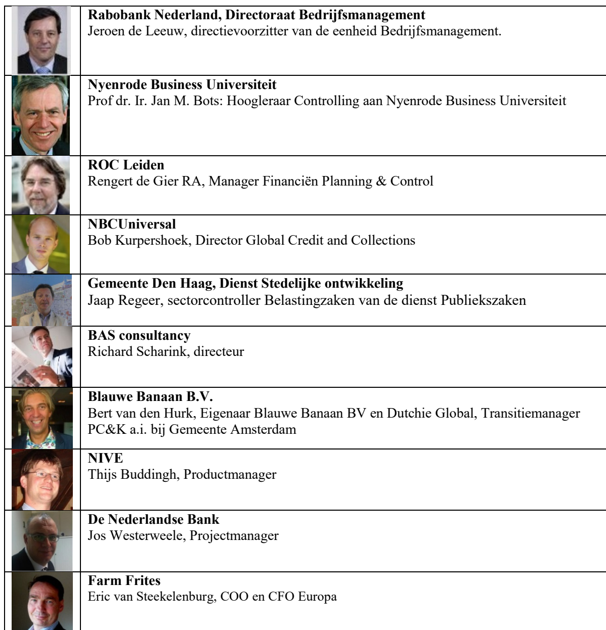
Tabel 5 Raad van Advies werkveldleden