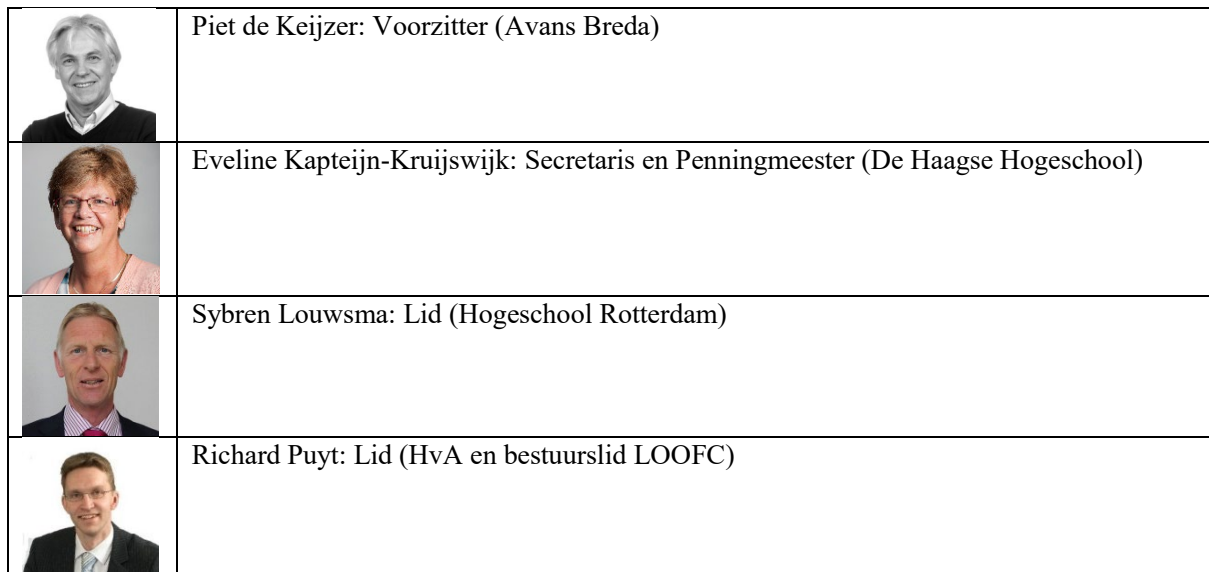
Tabel 6 Raad van Advies LOOFC leden