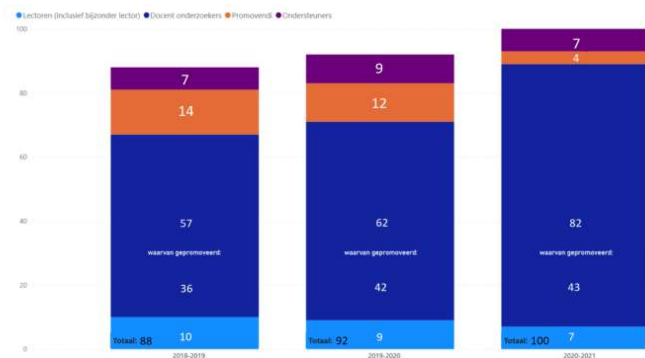
Figuur 3 Lectoraatsmedewerkers Domein Gezondheidszorg en Welzijn.

alle docent-onderzoekers (43 van de 82). Zie figuur 3 voor de personele inzet tussen 2018 en 2021.