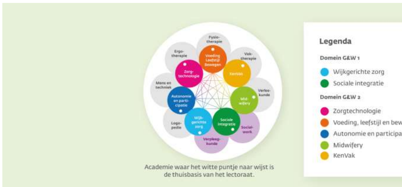
Figuur 2: organisatie Domein Gezondheidszorg en Welzijn Zuyd Hogeschool.

De verbinding tussen onderwijs, onderzoek en praktijk is binnen Zuyd georganiseerd in academies. Het managementteam (MT) van een academie bestaat uit de opleidingsmanager(s) en een lector. Het MT rapporteert aan de verantwoordelijke domeindirecteur. Het domein Gezondheidszorg en Welzijn heeft twee domeindirecteuren die gezamenlijk de directie vormen van het domein.